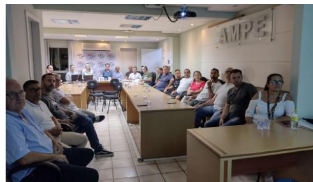
A reunião contou com a presença de integrantes da diretoria da entidade, além de associados, e da assessoria jurídica e contábil

Na oportunidade foi apresentado o relatório da gestão do exercício anterior (2023); a prestação de contas do mesmo período, com os pareceres dos Conselhos Fiscal e Deliberativo. Também esteve em pauta a autorização de venda do veículo Chevrolet Spin para efetivar a troca deste por outro veículo novo. “A prestação de contas é realizada para que nos-