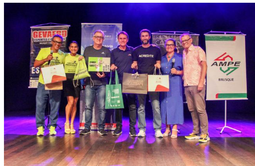
Além da AmpeBr, o Grupo Júlio Imóveis, Calçados Gevaerd e Camicerie Laura Cattani também foram organizadores do evento

Além da AmpeBr, o Grupo Júlio Imóveis, Calçados Gevaerd e Camicerie Laura Cattani também foram organizadores do evento.