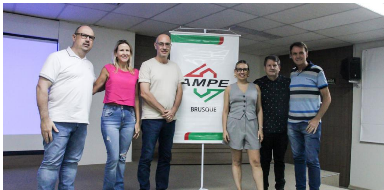
Os diretores da AmpeBr e integrantes do Núcleo Têxtil da entidade, com a palestrante do evento

Durante o evento, a especialista mostrou que é preciso entender o porquê das tendências, antes de aplicá-las em suas marcas. “As tendências vêm do comportamento. Então, primeiro precisamos compreender o que o consumidor está buscando, o que está acontecendo no mundo. Assim, iniciamos conhecendo e entendendo como esses fatores influenciam na moda para depois aprofundar e trazer formas, cartelas de cores, peças-chaves e o que está em alta no mercado da moda”, explicou.