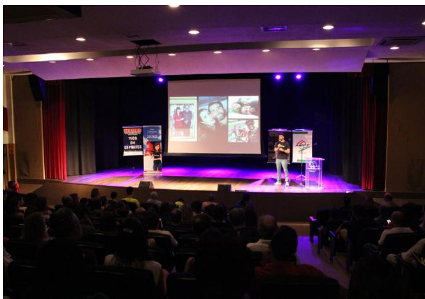
Um grande número de pessoas lotou o Teatro do CESC B para prestigiar o evento